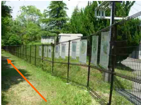
⑰一方社油脂工業さんの敷地フェンスに下東条地区の昔話が掲示されています。