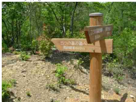
⑳上記標識が現れたら④-65つの森道分岐点です。