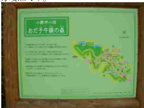
㉒上記案内板は小田方面出入口の現在地を標記しています。