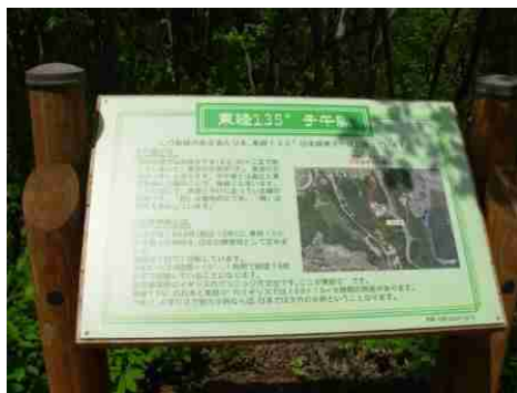
⑫東経135度子午線の案内板です。