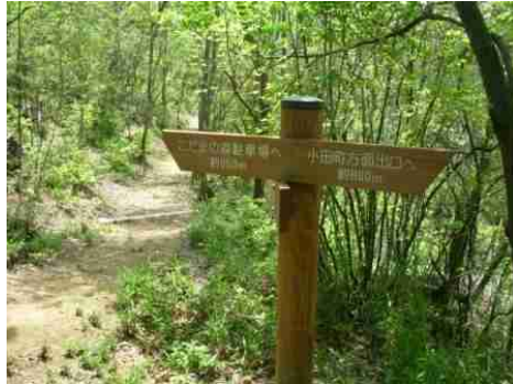
⑮上記標識が現れたら④-3ツツジの道合流点です。