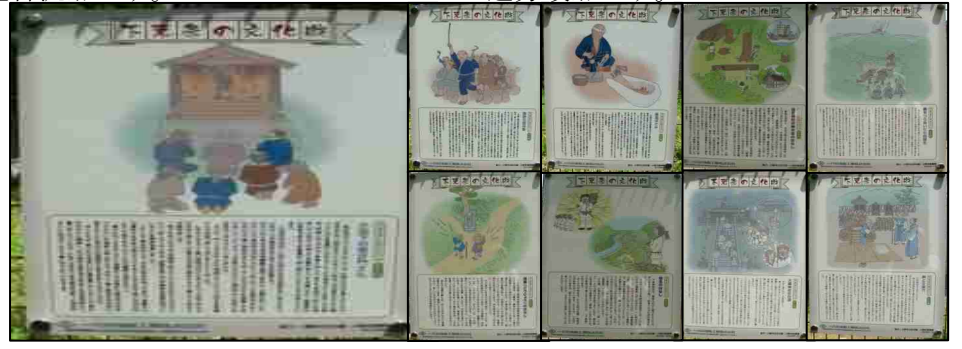
⑱上記9つの昔話が掲示され、休憩をかねて読まれてはいかがでしょうか。