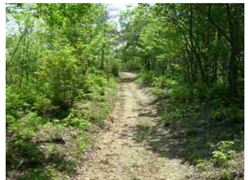
㉑小田方面出入口付近の坂道です。