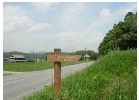
㉔上記標識が小田方面出入口です。