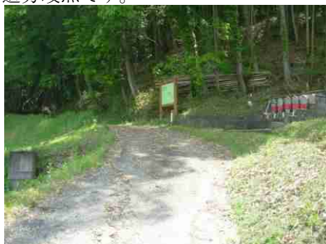
㉓小田方面出入口です。六地藏さんと案内板が目印です。