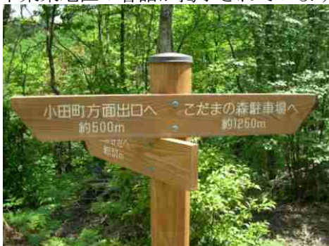
⑲上記標識が現れたら④-7水辺の道分岐点です。