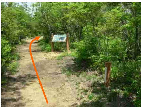
⑪案内板が見えてきました。