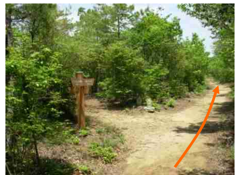
⑬標識と道祖神が現れたら④-3ツツジの道分岐点です。