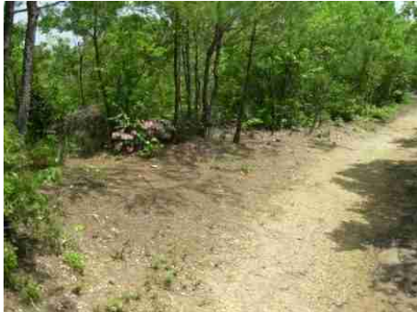
⑭上記写真の様に所々ツツジがきれいに咲いています。