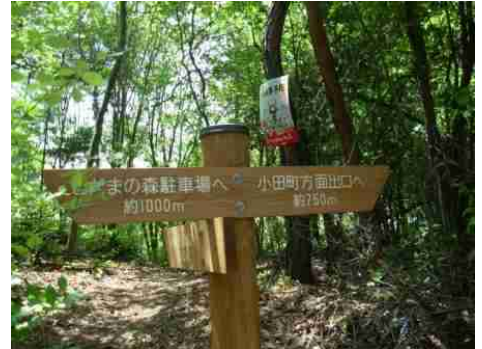
⑯上記標識が現れたら④-4ツツジの道分岐点です。