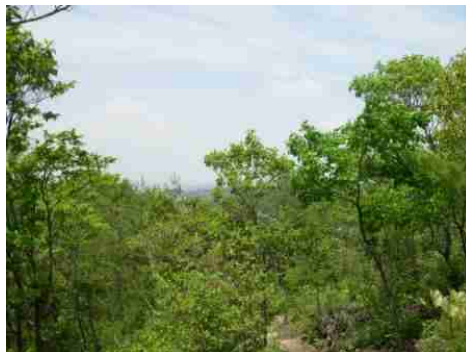
⑧写真には写っていませんが、ここからは千が峰が一望できるなど見晴らしの良いスポットが続きます。