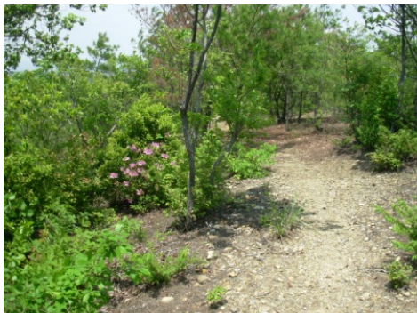
⑦ツツジがきれいに咲いていました。平成23年5月14日撮影