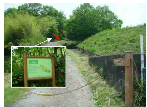
⑩茶色矢印が終点地です、そこには上記案内板があります。