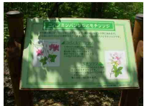
⑥ツツジの案内板があります。