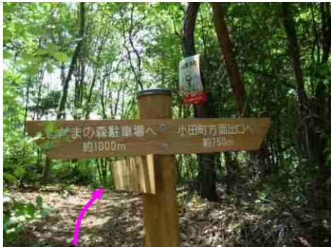
①この標識が見えると矢印方向左へ進んでください。注つつじの道とは表記されてませんので要注意。