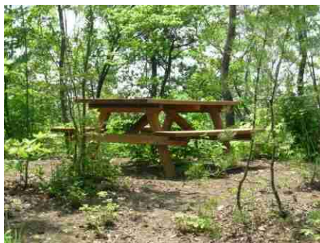
⑤中間点付近には休憩の為のテーブルセット1台があります。