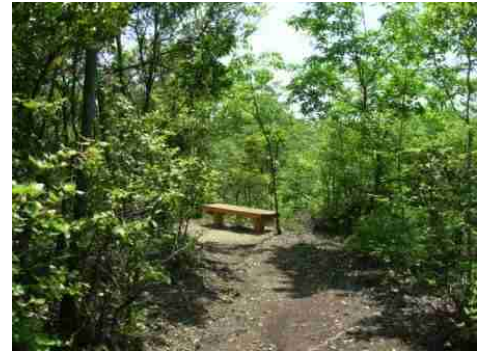
③休憩の為のベンチがあります。