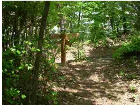
②①の標識を20mほど歩いた地点より撮影しました。正面は見づらいですが一方社さんの敷地です。