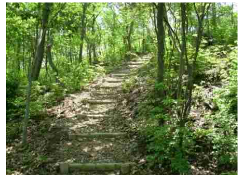
⑨この階段を下ると終点です。