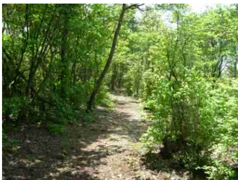
④なだらかな下りが続きます。