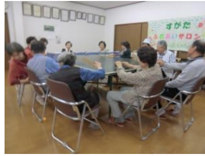
卓球バレーを楽しんでいる様子

足の不自由な方もできます。本来はバレーボールのルールなのですが、菅田ルールに変更して対戦しています。汗が出るほど力が入り、思いつきり笑い、大きな声を出して楽しんで遊んでいます。