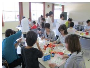
もう少しで出来あがり

「お菓子バッグ」は、阪神淡路大震災後、避難所で子ども達のおやつやおもちゃなどは考えられていない状況のなか、子ども達のことを思いつて考え出された「お菓子ポシエット」をヒントにしています。お菓子を食べた後も薬入れ、大事な物入れなどに利用できるように牛乳パックを使って作る「お菓子バッグ」を、クローバーで考えたものです。