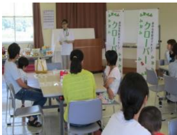
まず講師の説明を聞き…

「お菓子バッグづくりで防災を考える講習会」を6月17日(日)10時から市民研修センター視聴覚室において開催しました。