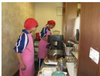
コーヒーを入れる 二人のトライやる生

いろいろお話を伺っているう ちに緊張もほぐれたのか、少し 笑顔がのぞくようになりました。 私は、そんなさわやかな姿に見 とれながら一杯のコーヒーを注 文しました。