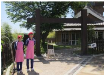
誉田の館で接客体験

ここは「ミセン」下東条の東隣 にある「ミニユニティレストラン 」誉田の館「いろどり」です。5 月の下旬になると旭丘中学校の トライやるウィークが始まる頃 だなど思っ様子を伺いにお邪 魔してみました。